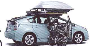
フレンドマチック (自操式)