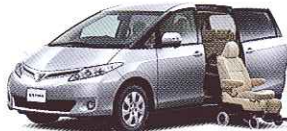
リフトアップシート車